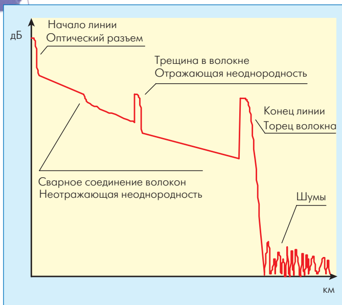
Рис.2 Типичная рефлектограмма

снимает характеристику через определенные промежутки времени, определяя расстояние до каждого события.